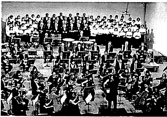
全国の演奏家の支援で開かれたニューフィル千葉支援ネットワークコンサートは超満員となった。(2007,8,14)